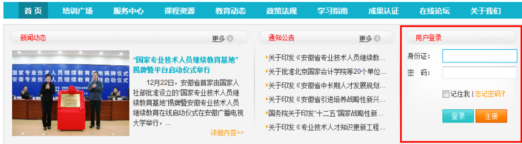
图 2 用户注册