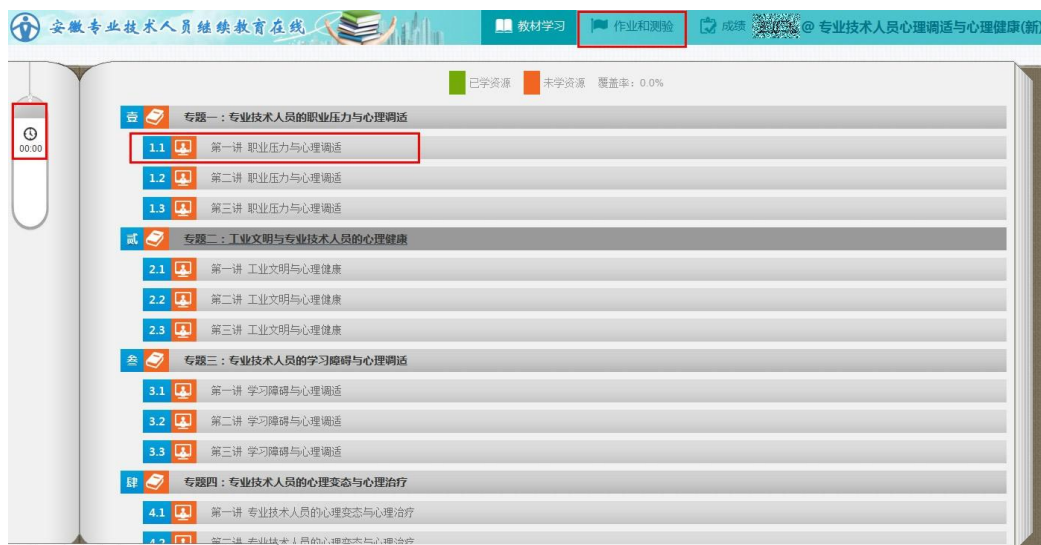
图 11 课程学习

(3) 在所显示的课程列表中选择一门课程，点击【开始学习】，便进入具体课程学习界面(图11)。