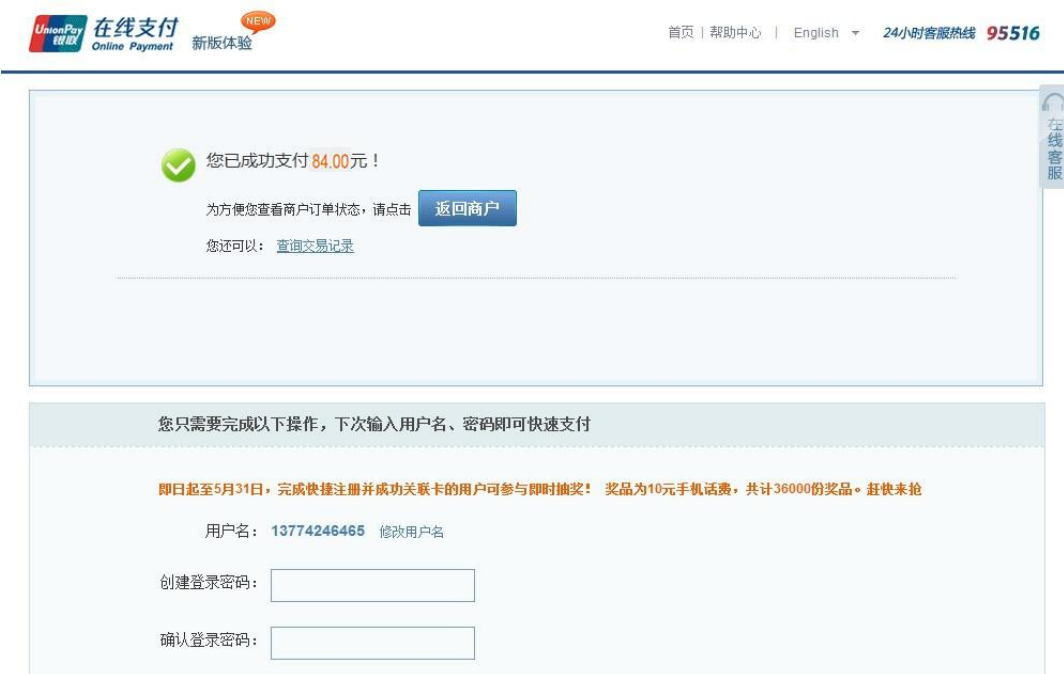
图 7 缴费成功