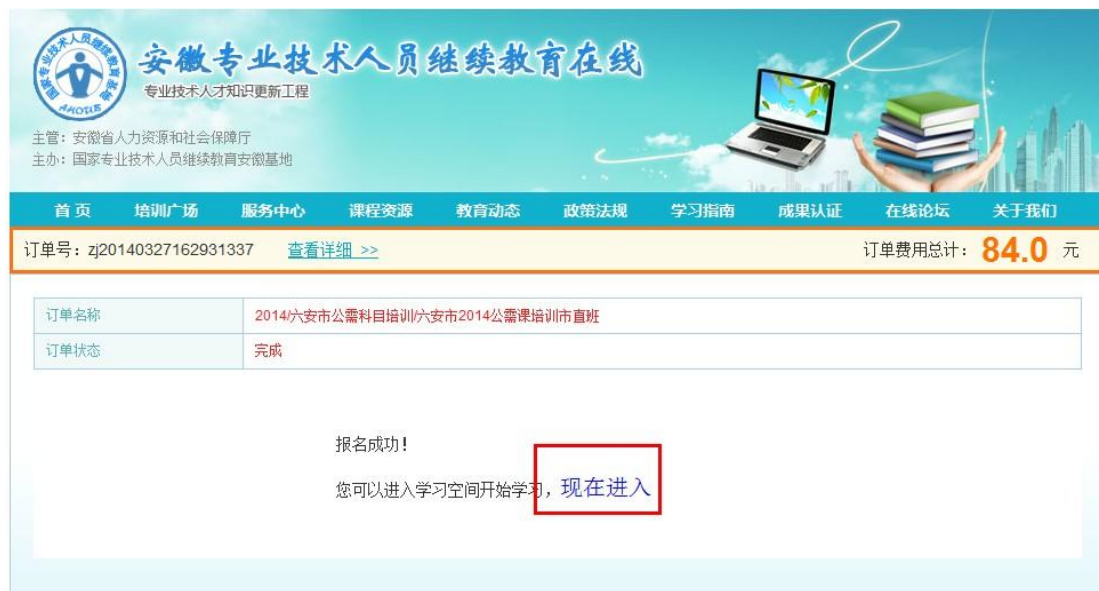
图 9 进入学习空间