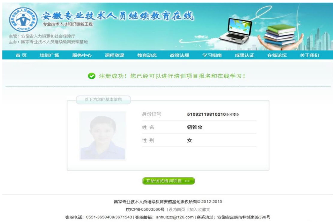
图 3 完成注册

(3) 上传报名信息照片后，点击【完成注册】，提示注册成功(图3)。如果暂不上传照片，可直接点击【跳过此步完成注册】，提示注册成功。(注：照片请上传证件照照片，此照片会用于最终培训证书的打印。)