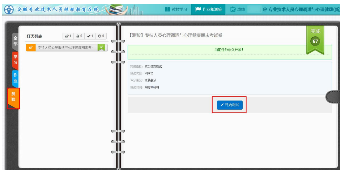
图 14 课程测验