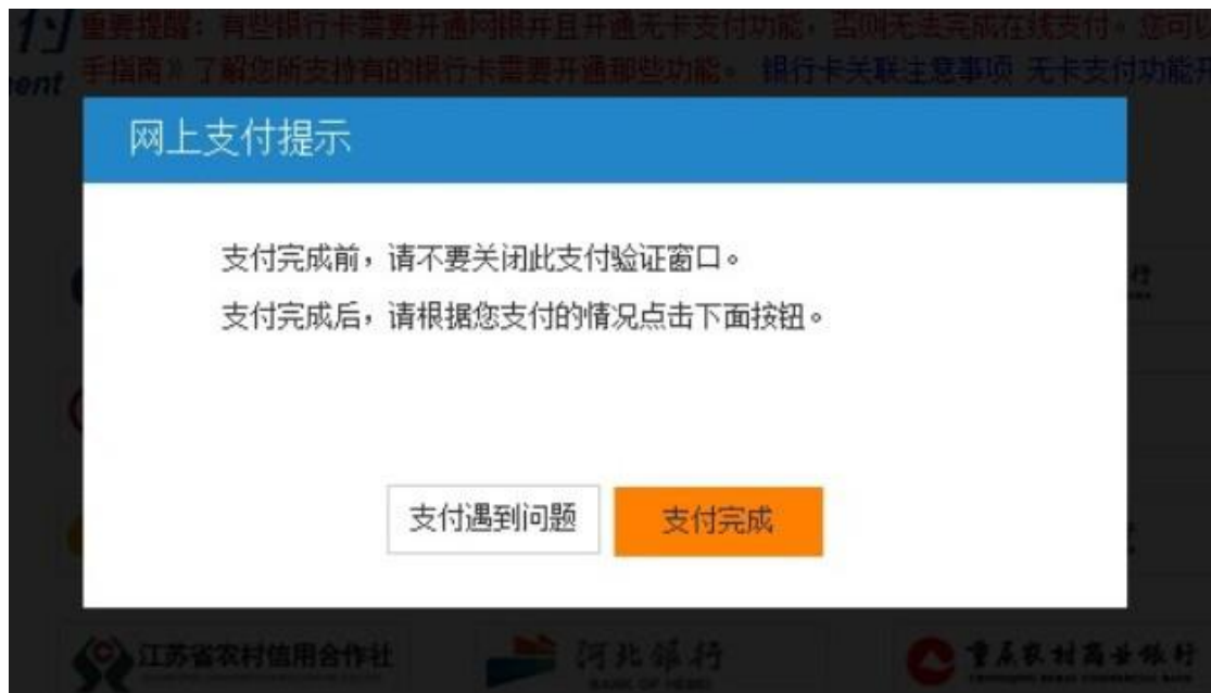
图 8 支付确认

(3) 成功通过网上支付所选课程全部费用以后，点击【返回商户】，付款成功点击【支付成功】予以确认，然后再点击【现在进入】，进入我的学习空间。如图 8、图 9 所示。