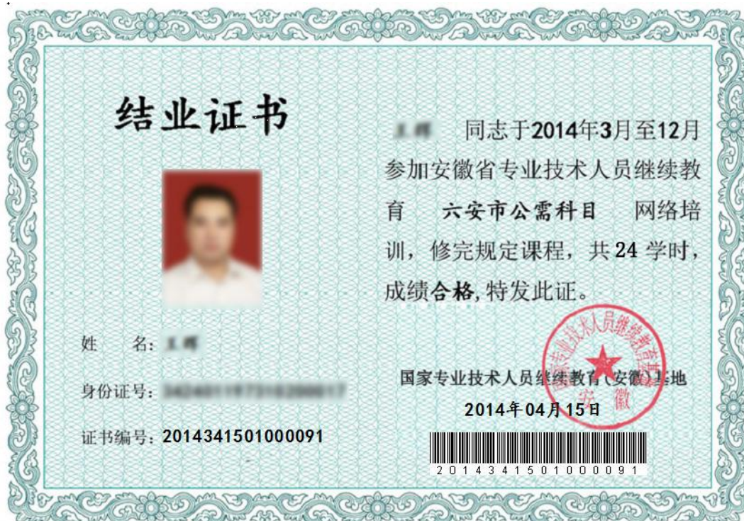
图 16 结业证书