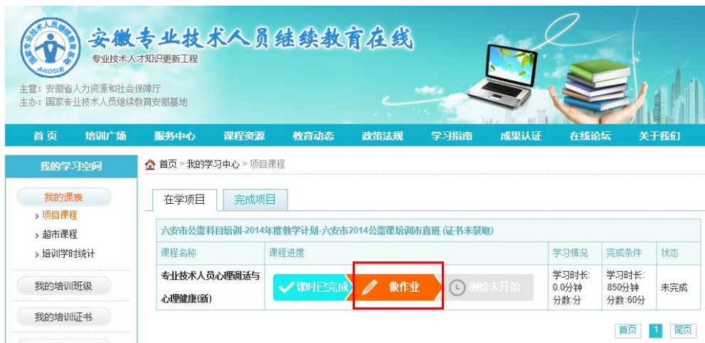
图 12 作业入口