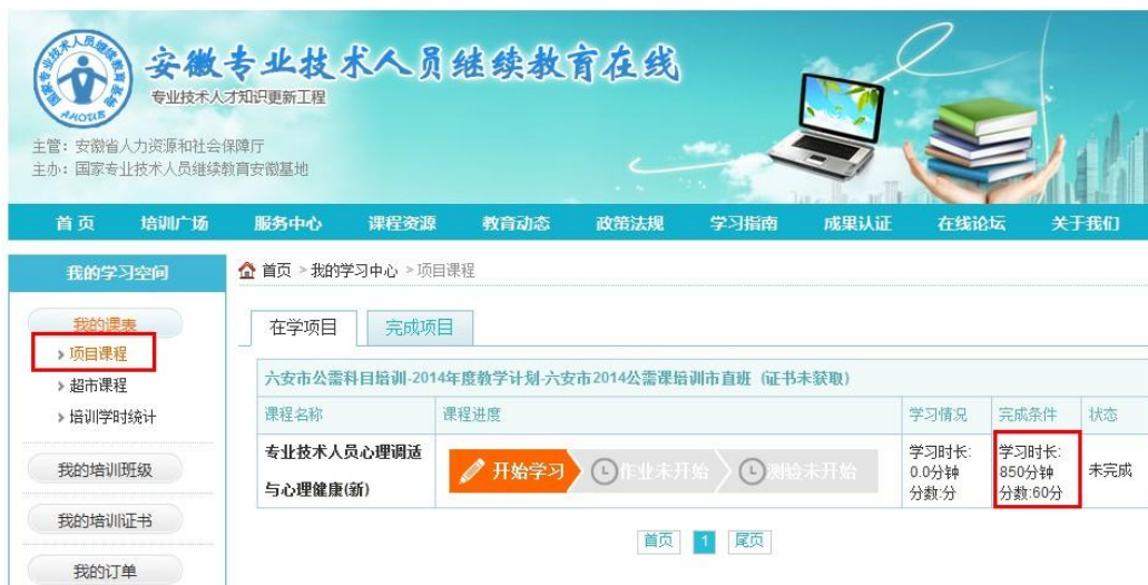
图 10 在学课程

(2) 在学习空间中点击【我的课表】—【项目课程】，进入在学课程列表(图10)。