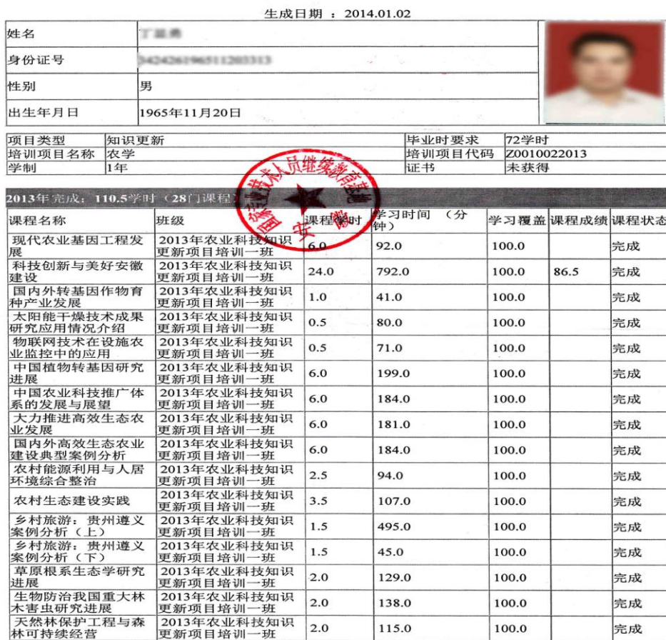
图 17 学时证明