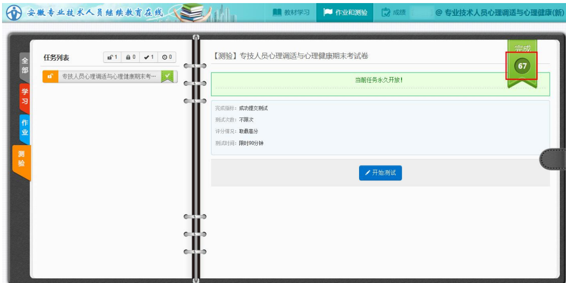
图 15 测验成绩