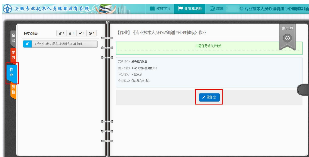
图 13 作业界面